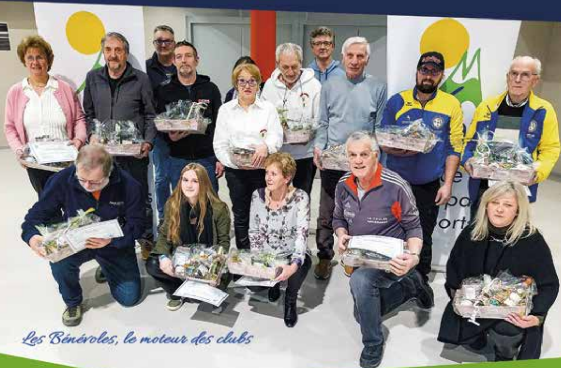
Les Bénévoles, le moteur des clubs